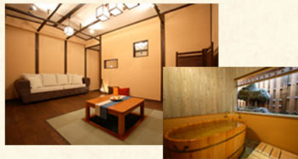
半露天風呂付き和洋室「ゆう」