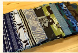
男性用色ゆかた (レンタル料 500円)