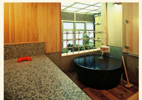
陶器風呂 るりの湯

ひのき・岩・陶器と趣の違う三つの浴槽はそれぞれが貸切専用。予約不要で御自由に御利用くださいませ。 (利用時間：15：00～23：00、6：30～9：30)