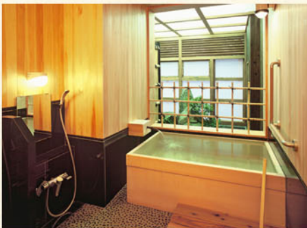
ひのき風呂 ほの湯

城崎温泉の源泉をそのままに。塩分を含んだ泉質は身体の芯から温まる保温効果と保湿効果があり。温泉の癒しで日頃の疲れをお取りください。